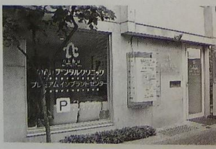
のぶ・デンタルクリニック

予防歯科は突き詰めると、全身の健康につながるそう。「全身が健康でないと血液や唾液がキレイになりません。血液や唾液が汚れていると口腔内環境も改善しません。自費負担ですがサプリメント治療も行っています。これからは歯だけでなく、トータルで全身の健康を考える治療が大切だと思います」(小原澤先生)